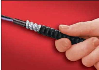
1. Préparer le câble