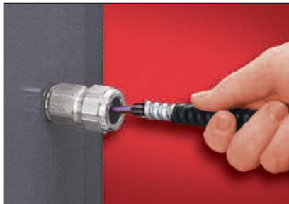
2. L'insérer dans le raccord