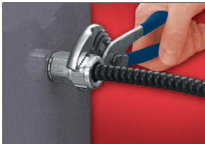
3. Resserrer l'écrou du presse-étoupe

Avvertissement : Toujours s'assurer que le système est mis hors tension avant de procéder à l'installation.