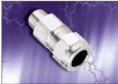
Série StarTeck md (ST)

Les raccords StarTeck md conviennent à une large gamme de câbles afin de minimiser les risques de mélanges raccords-câbles en chantier. Offerts en grosseurs de 1/2 à 4 po, les manchons conviennent aux câbles de diamètre extérieur sur gaine de 0,525 à 4,340 po.