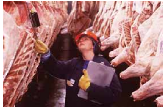
Pour les conditions défavorables qui existent dans les usines de traitement des aliments — congélateurs et aires de lavage sous pression — rien de mieux que le système étanche T&B qui résiste tout aussi bien aux températures basses qu'élevées.

Vous trouverez dans les pages qui suivent une brève explication des produits qui résistent le mieux aux températures extrêmes et sont donc recommandés pour l'industrie du traitement des aliments et breuvages.