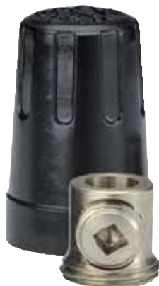
Pour fils en cuivre seulement