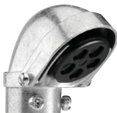
CIEFSA-1/2 / CIEFSA-4