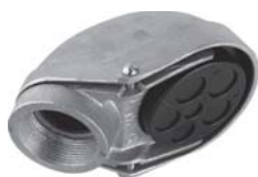
CIEFA-1/2 / CIEFA-4

REMARQUE : Les connecteurs de grosseur nominale de 3/8 po se posent sur une débouchure de 1/2 po.